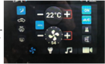
HMI - Graphics by the customer