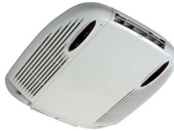
mascherina interno cabina Interior cabin mask