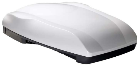
modulo esterno a tetto External roof module